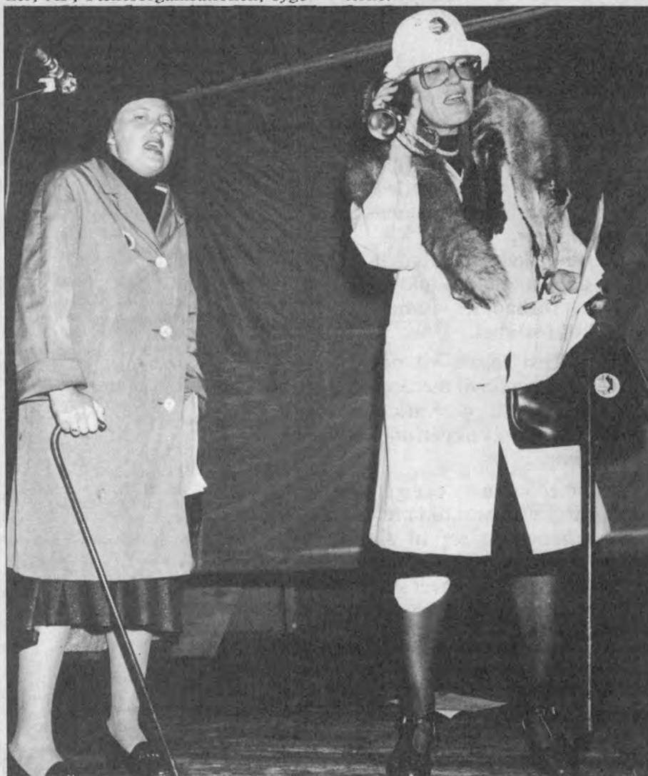
Cabaret i Svendborg - 37 år efter konflikten: »Der var da noget om nogle forhandlinger i 81. Blev de aldrig til noget? »Nu er der i alt fald 7 års ventetid på socialforvaltningen.

I den sidste måned har 3 arbejdsløse deltaget i strejkearbejdet i Svendborg, hvilket har givet nyt krudt i aktiviteterne.