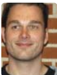
Thomas Sørensen Center for Misbrugsbehandling, Århus Kommune

– TR-vilkårene! Det er vigtigt, at vi får tidskompensation for TR-arbejdet, for i dag er det ofte sådan, at kollegaerne tager over. Ledelsen her bruger os rigtig meget både i forhold til sygemeldinger, omorganisering og i forhold til at undgå sygemeldinger, og det er fint, men der er eksempelvis ikke ansat nogen til at kompensere for de 14 timer om ugen, der er afsat til mit TR-arbejde. – Senioraftaler er også vigtige. Vi er rigtig mange i faget, der er oppe i årene. På min arbejdsplads, hvor vi er 20 medarbejdere, er der kun én under 50 år. Ønsker man at holde os på arbejdsmarkedet, bliver der nødt til at være nogle senioraftaler. Det har man talt om i mange år. Derfor tror jeg, vi selv er nødt til at være med til at finansiere det via overenskomsten. – Når jeg fremhæver disse områder, er det ikke fordi, jeg ikke synes, at vi skal have en bedre lønudvikling. Men det her er også vigtigt, og vi bliver som organisation nødt til også at have fokus på disse punkter.