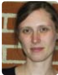
Sesse Trusell Jobcenter Skelbækgade, Københavns Kommune

– Det er vigtigt, der kommer til at indgå en sagstalspolitik i overenskomsten, så hver arbejdsplads tager stilling til, hvor mange sager, man højst skal have for at kunne gøre sit arbejde både fagligt forsvarligt og rettidigt. For mig, der sidder med førtidspension og kontanthjælp, bliver det altid pensionsafgørelserne, der må vente, fordi der ikke er så meget fokus på dem som på kontanthjælpsopfølgningen. Det er