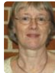
Hanne Sørensen Jobcenter, Tønder Kommune

– Jeg tænker, at hvis man ikke har så mange penge at uddele af, er sagstal måske noget af det, man kan få igennem, og på den måde forbedre arbejdsvilkårene på arbejdspladserne. Og samtidig tror jeg, det vil gøre sagsbehandlerne gladere.