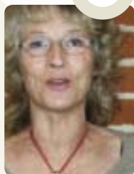
Birgit Flensted-Jensen Jobcenter, Egedal Kommune

TEKST: BIRGITTE RØRDAM