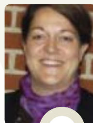
Mette Dyrby Gnisa Familie- og Ungecenter, Gladsaxe Kommune

– Når kollegaerne selv synes, det er så vigtigt at have en TR, og det synes de jo, så synes jeg, at de skulle deltage mere. Det kan vi måske opnå, hvis vi får vores DS-konsulent ud for at fortælle, hvorfor det er vigtigt, at medarbejderne klæder tillidsrepræsentanten på. Og følge op på det ved eksempelvis at deltage i klubmøder for at se, om det er blevet bedre.