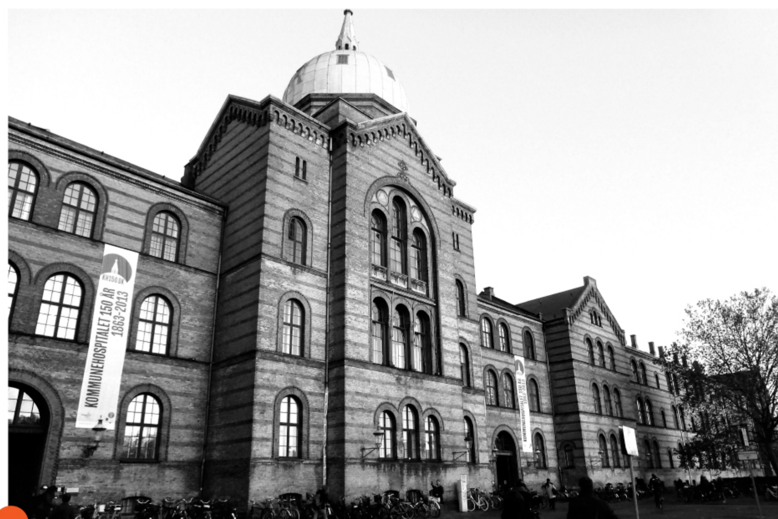
Her startede det - Københavns Kommunehospital