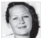
TEKST LONE MUNKESKOV, GÆSTEKLUMMENIST

"Det var min skyld". Ordene ligger mellem linjerne i de mange livsfortællinger, jeg læser om de af Kriminalforsorgens klienter, der havde en problematisk barndom, eller som børn blev anbragt udenfor hjemmet. Udsagn som "jeg var for vild til, at min mor kunne klare mig", "jeg var ustyrlig i skolen, og derfor kom jeg på institution" og mange andre af slagsen.