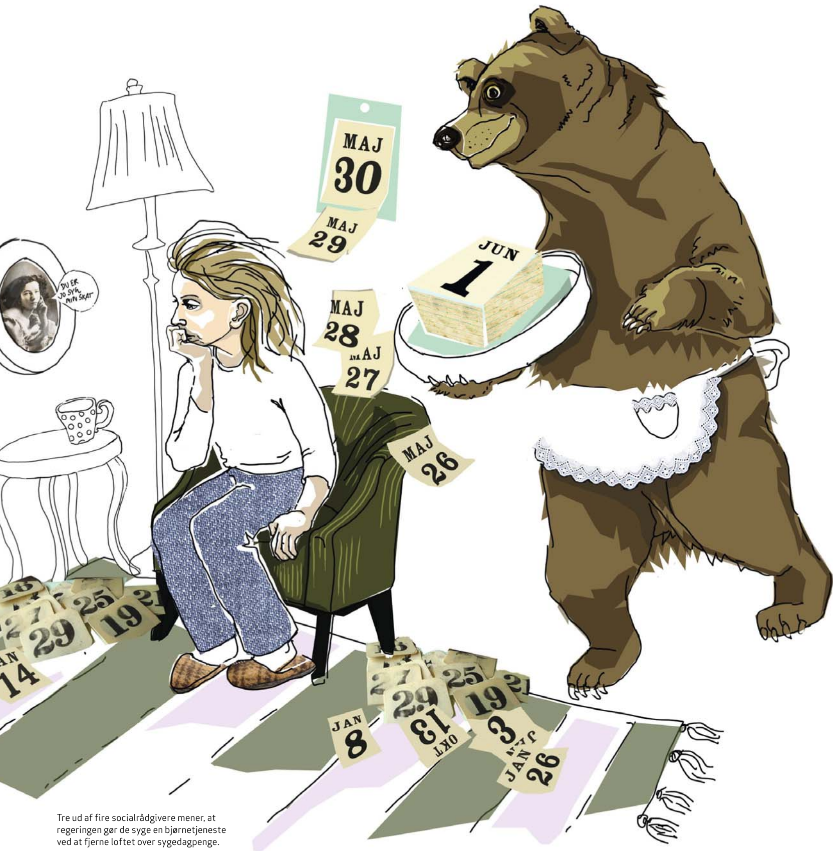
Tre ud af fire socialrådgivere mener, at regeringen gør de syge en bjørnetjeneste ved at fjerne loftet over sygedagpenge.